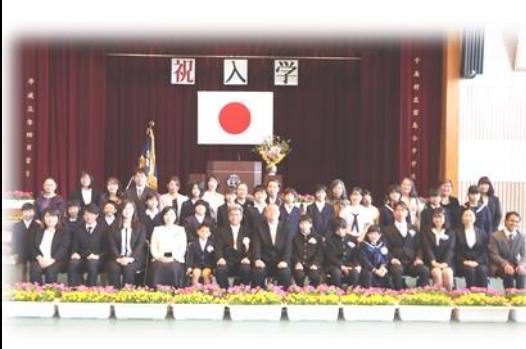
【入学式終了後に撮影した集合写真】