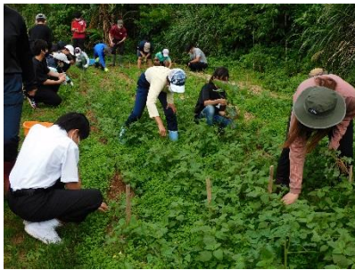
ひと月でこんなに成長！