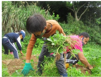
一生懸命除草しました