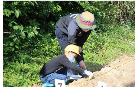
一粒一粒おおきくな一れ