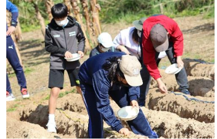
畝に沿って丁寧に種まき

コロナも落ち着き「収穫祭」ではたくさんの島民の方にお配りができることを願っています。