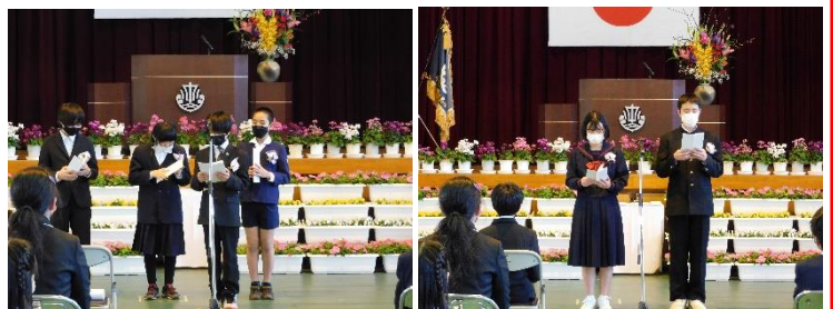
卒業生答辞 小学6年生（左） 中学3年生（右）