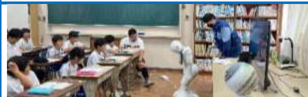
防災教室(ペッパー君も来校しました)