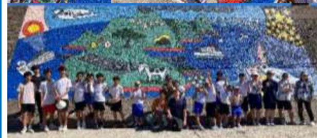
完成後の記念写真