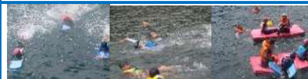
水泳教室 (天候にも恵まれいっぱい練習できました)

これまでデザインの発案、材料集め、事前準備の後、6回の作成作業を経てついに壁画が完成しました。最後は日差しの強い中、暑さ対策をしながらの作業となりましたが、最後まで丁寧に色塗りをしました。諏訪之瀬島の新たなシンボルが増えましたね。みなさんお疲れ様でした。