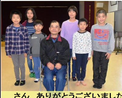
さん ありがとうございます

緊張の連続だった。式が始まると、緊張が和らぎ、笑顔がこぼれ出す。司会者の声援で、緊張が和らぎ、笑顔がこぼれ出す。司会者の声援で、緊張が和らぎ、笑顔がこぼれ出す。司会者の声援で、緊張が和らぎ、笑顔がこぼれ出す。