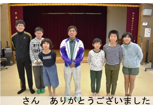
さん ありがとうございます

タモトユリを食べる動物はいますか？ 野生のヤギがタモトユリの葉を食べます。また、蛾がタモトユリの花芽を食べてしまいます。 タモトユリは病気になることがありますか？ 水分が多いと球根が根腐れします。水はけが良くないと上手く育ちません。 タモトユリの開花期はいつ頃ですか？ タモトユリの原種は、七月の上旬から中旬にかけて咲きます。また、移入種は六月下旬ごろに咲きます。 タモトユリはどのようにして育てるのですか？ タネから育てる場合は、水はけの良い土にまきます。粘土質の土ではなく、鹿沼土などが良いです。また、タネのうち、だいたい十パーセントくらいが花を咲かせます。 タモトユリはどのように管理しているのですか？ 平成五年に「タモトユリ保存会」が設立されました。ウエウラ植栽地のタモトユリを管理、調査しています。平成二十八年に「タモトユリ展望施設」と改名され、タモトユリ保護区を設けて管理をしています。 また、大阪学院大学の先生が、口之島を何度も訪問して、タモトユリの調査・研究をしておられます。 以前は島内にたくさん咲いていたのですが、戦後に球根を掘って売っていたため、数がだいぶ減ってしまいました。一球二万円していたと言われており、長崎を経由してオランダに運ばれ、カサブランカの原種になりました。現在では、人や野生ヤギが近づけない断崖にのみ残っています。